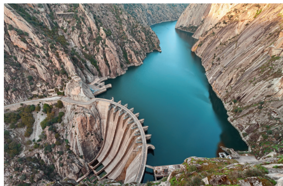
Diga di Aldeadavila – Spagna (lago artificiale o di sbarramento)