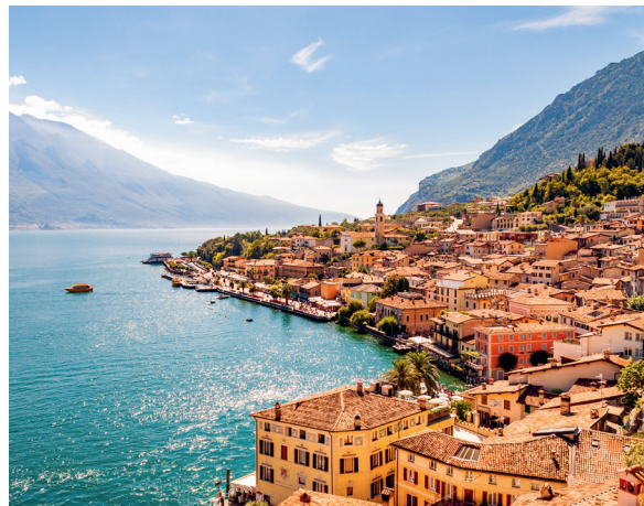
Fascia perilacuale con costruzioni antropiche.