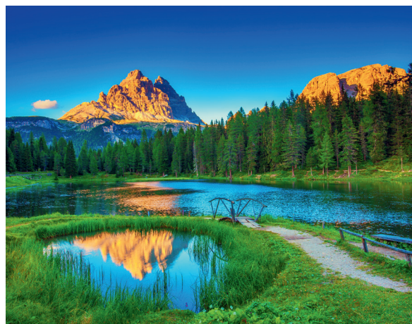
Fascia perilacuale con pendenze minime e prevalenza di vegetazione boschiva.