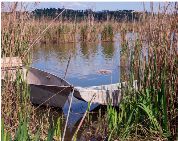
Lago con fascia riparia a canneto.

Importante è però anche la fascia perilacuale , ossia la fascia attorno a un lago che comprende parte della zona litorale e si estende per una superficie variabile. Di seguito alcuni esempi di ambienti lacustri.