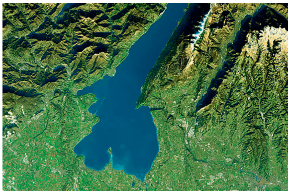
Lago di Garda (origine glaciale)