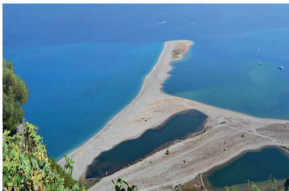
Laghetti di Marinello – Sicilia (laghi costieri)