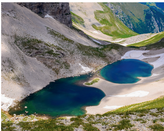
Fascia riparia con pendenze accentuate.